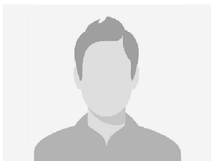
Foto de Perfil